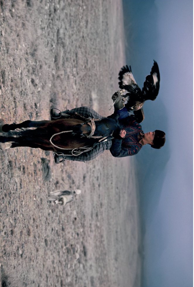
Jakt med falkar och örnar är omtyckt bland de centralasiatiska folkten, särskilt i Kazakhsran och Kirgizstan.