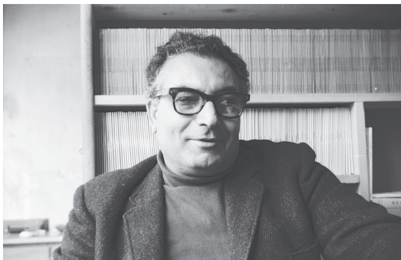
Yaşar Kemal (1923–2015)