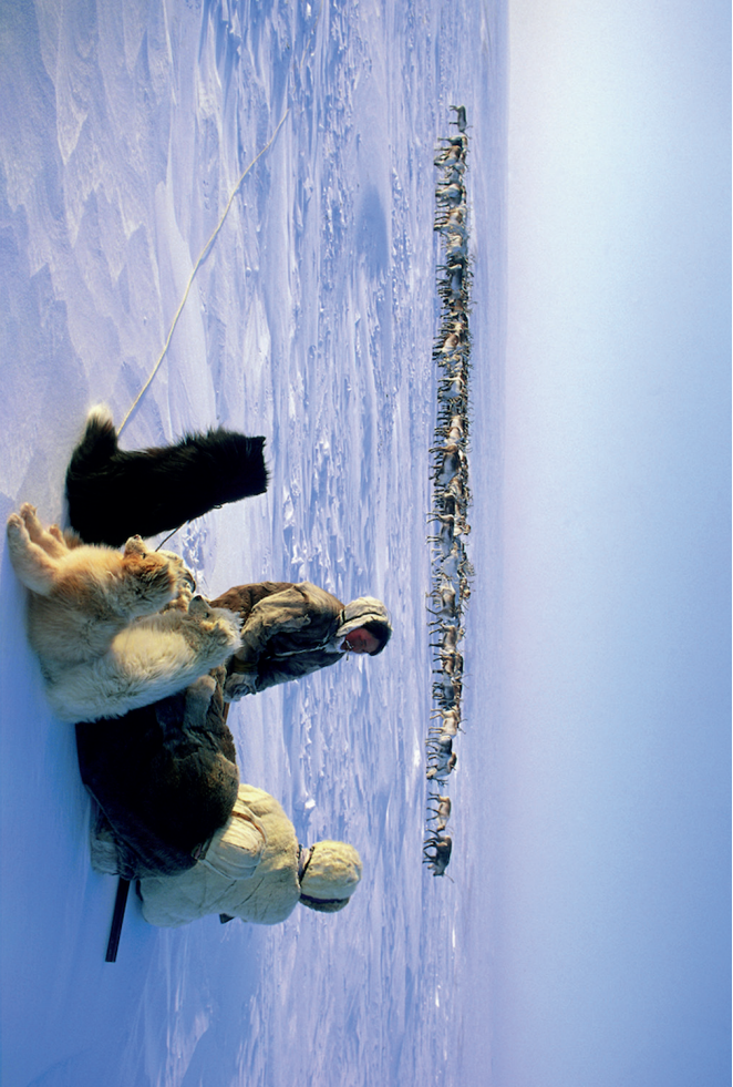
Jakuterna lever i norra delen av Sibirien. De är i första hand jägare, fiskare och renskötare.