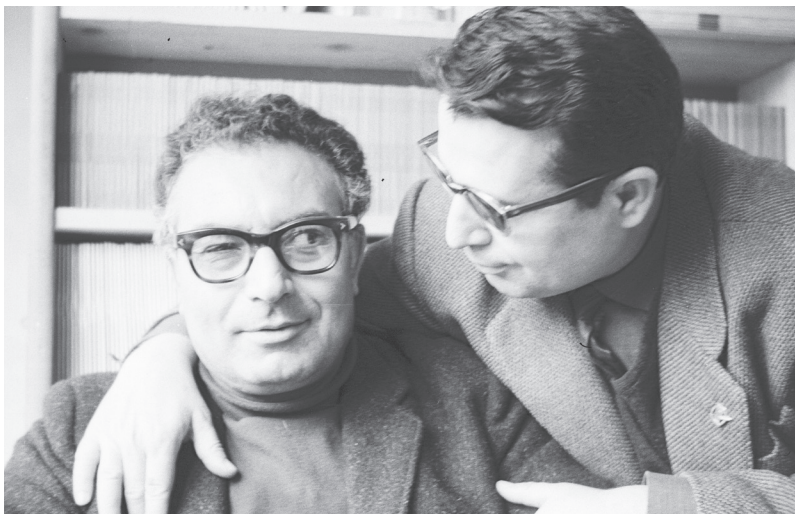
Yaşar Kemal (1923–2015) och Hüsamettin Bozok (1916–2008)