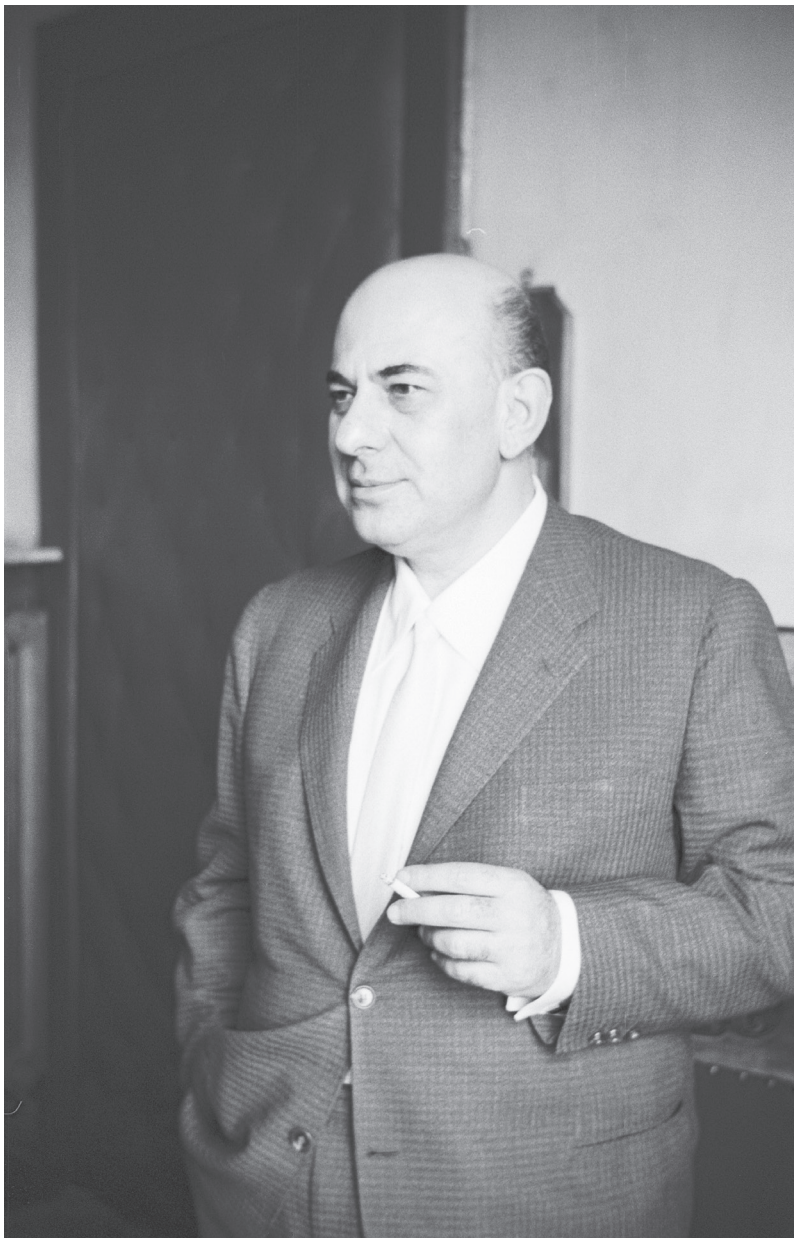
Orhan Hançerlioğlu (1916–1991)