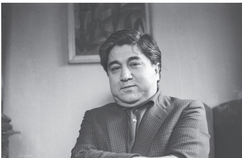
Aziz Nesin (1915–1995).