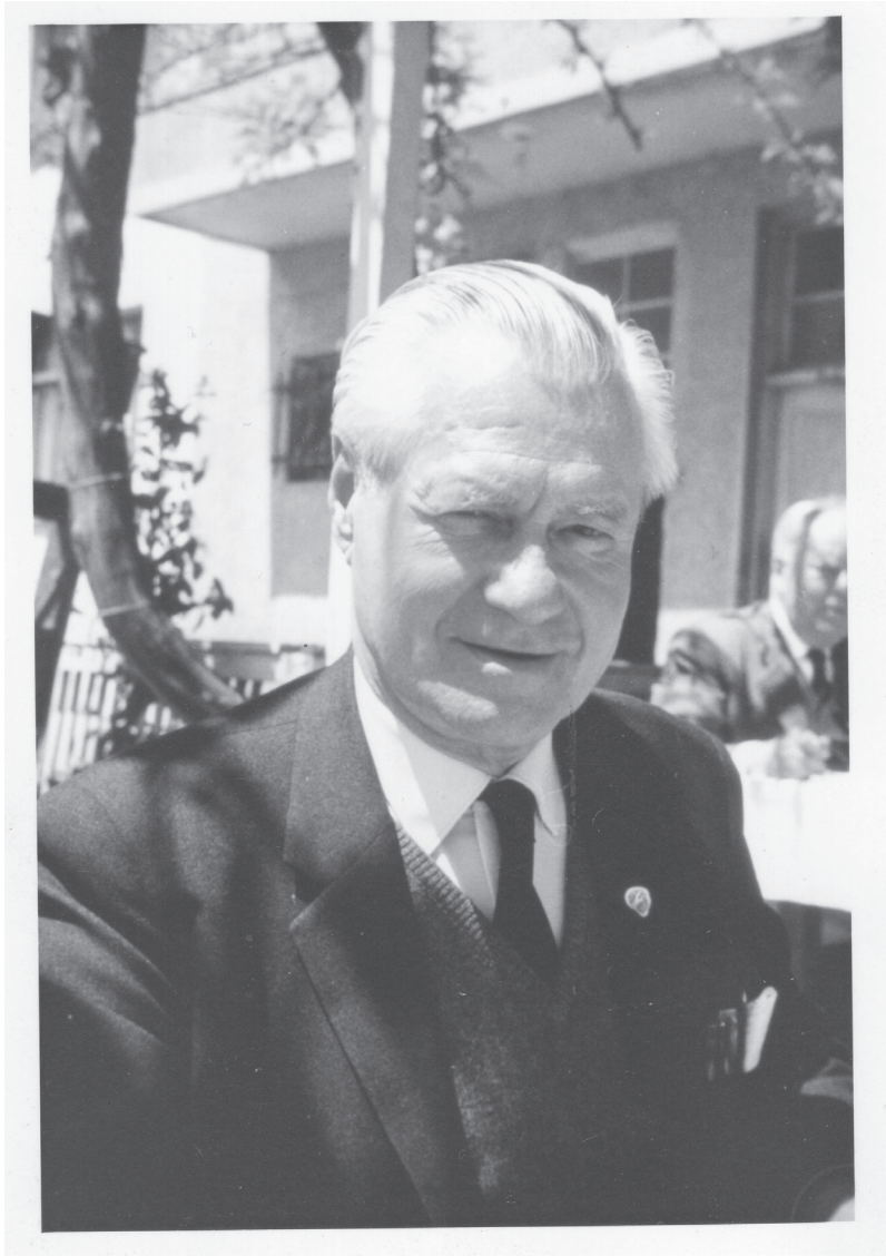
Konsul Torsten Weman (1901–1981)