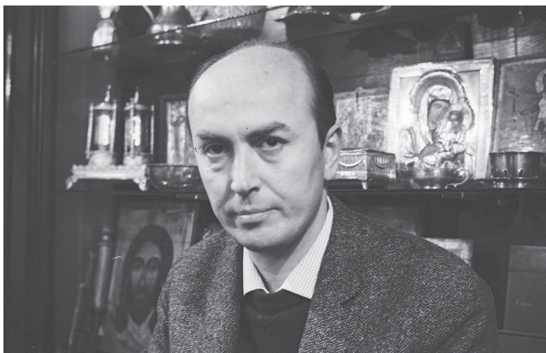
Edip Cansever (1928–1986)