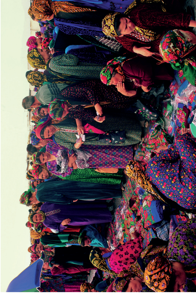
Den här bilden visar kvinnor på marknaden in Ashgabat, Turkmenistan, i den södra kanten av Kara-Kum öknen.