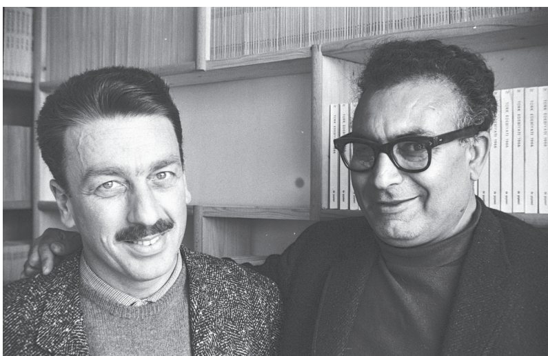
Yaşar Kemal (1923–2015) och Memet Fuat (1926–2002)